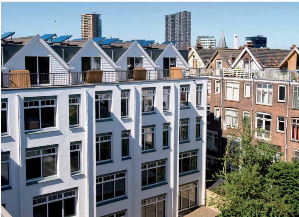
Sleephelling in Rotterdam-Noord, het eerste renovatieproject in Nederland dat is uitgevoerd conform de richtlijnen van passieve bouw.

Vacuümglas, zoals Spacia van Pilkington, is een beter, maar kostbaar alternatief. Een opbouw van 6,2(13)4* heeft een Ug van 0,7. Hierbij staat de 6,2 (2x3 mm glas en 0,2 mm microspouw) voor het vacuümglas en is de 13 millimeter spouw gasgevuld met Argon. Dezelfde opbouw maar dan met een 9 millimeter spouw gasgevuld met Krypton, haalt 0,6. Een eerste voorbeeld van een project in Nederland met Spacia is de Hermitage in Amsterdam (zie Glas in Beeld nummer 5 - oktober 2009). Een nadeel is dat vacuümglas een zichtbare 'beschermcap' heeft die het punt beschermt waar de lucht uit de microspouw is gezogen.