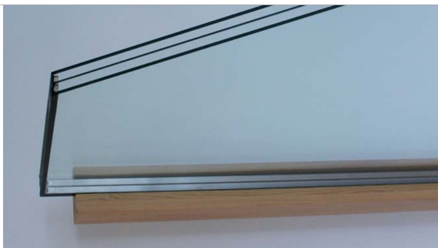
Triple-glas met symmetrische opbouw.

Het ontbreken van specifieke eisen en richtlijnen voor tripleglas zorgt ervoor dat er verschillen zijn tussen de diverse producenten. Er is momenteel wel een werkgroep van 'glasdeskundigen' die in samenwerking met Kiwa een BRL ontwikkelt, maar die is nog lang niet definitief. De werkgroep dient hierbij rekening te houden met de dubbel zolange garantieperiode die we in ons land kennen en loopt daarnaast tegen het feit aan dat ook de Europese productnorm voor isolatieglas (NEN-EN1279) eigenlijk alleen over dubbelglas gaat. Ook een inventarisatie bij alle KOMO-certificaathouders voor isolatie-